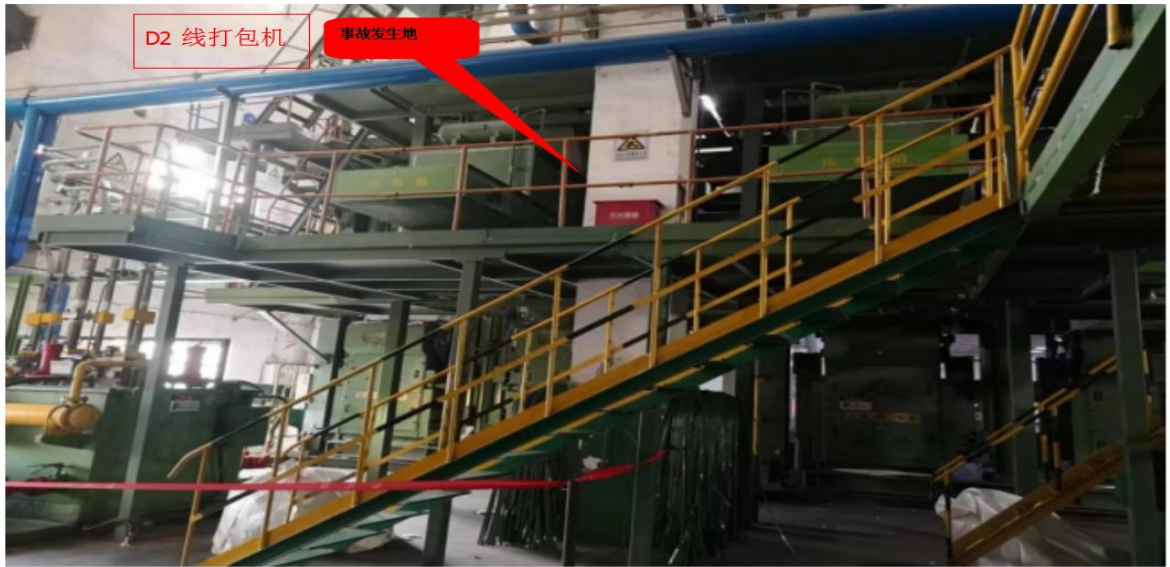
图 2 事故现场