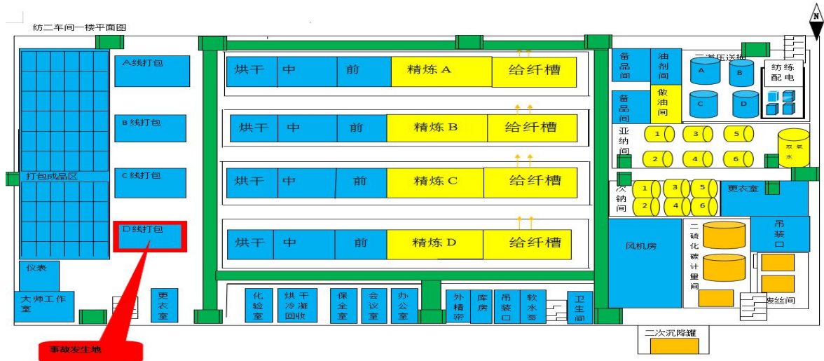
图 1 纺练二车间平面图

包机设备，使用该铁质金属罩，罩住接近开关，打开安全门，接近开关失效，打包机设备正常运行。