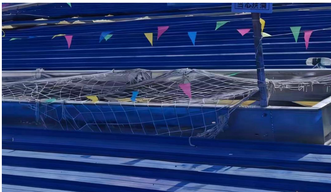
图二 事故发生后洞口防护破坏图